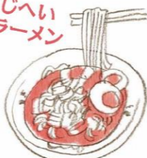
あじへい ラーメン