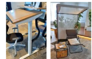
昇降・角度の調整ができます。 ゆったりとした椅子が心地よさそう、