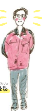
ちょう びんや 張 敏也