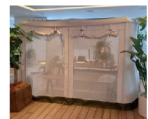
オフィスの中にテントが!