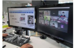
自社でのウェブ開催、大成功!

前期の方針説明会は外部の方に「協力をいただきましたが、今回は社内だけでウェブ開催を運営しました。全部門の方針を聞き、みんなで共有することができて良かったです。下期も全員参加で頑張っていきたいと思います!!