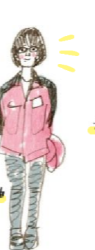
おかむら まゆ 岡村 麻由