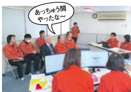
最終発表会では、社長や会長の前でもしっかりとプレゼン。若いっていいですね。オレンジ色の作業服がなじんできたところで、学生たちとはお別れです。