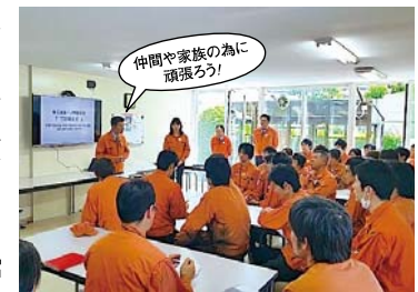
仲間や家族のために頑張ろう!

「TSS」とは世に言う、トヨタ生産方式のことであり、アイシン精機様が「JIT（ジャストインタイム）」の思想に基づき開発された市場運動型生産システムのことです。 一ノ坪製作所は以前から、TSS講習を不定期で受講してまいりました。今回、講習元であるアイシン・ヨホホ様より、年間通じてのコンサルティングを受けてはどうかとの提案をいただいたので、まずは3/14・16の3日間、工場診断を受けることに。その診断結果を、アイシン精機様の安城工場へ工場見学を兼ねて、幹部で聞きに行きました。診断結果を聞いた後は工場見学をさせてもらい、社内で何度も協議した結果、