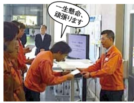
三重工場でも発足式が行われ、社長からプロジェクト推進メンバーへの激励がありました。

TSSコンサルティングを導入することで、何が変わるのか? 今は私たちがまだ手探りですが、また次号以降で読者の皆様にお伝えします。